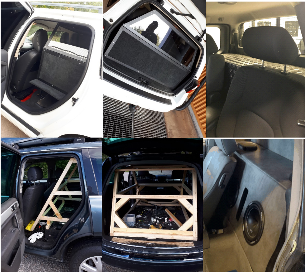
Två av ovanstående bilder avser Stomme som sedan kläs in.